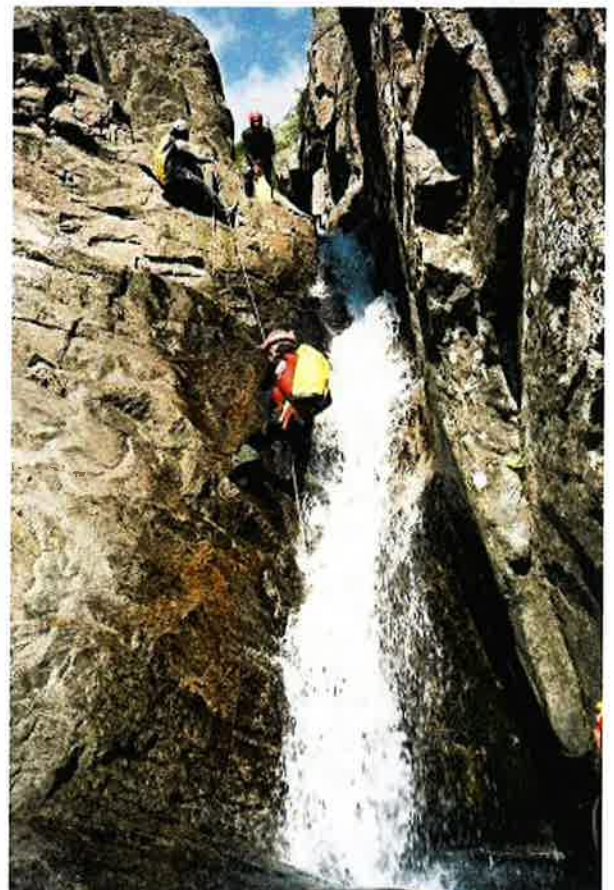
en fin de parcours