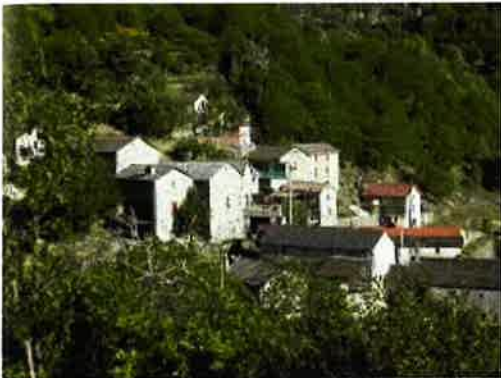
le hameau de la Penderie