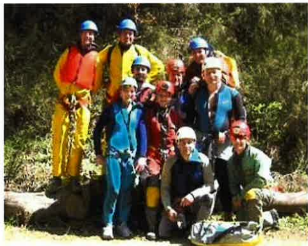
prêts pour le départ du canyon de la Haute Borne