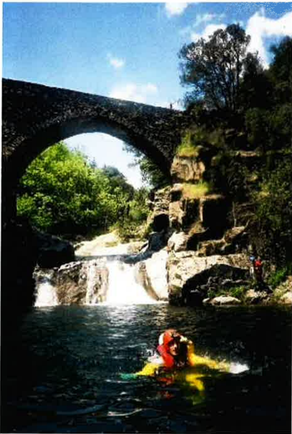
un peu de natation assistée pour Olivier