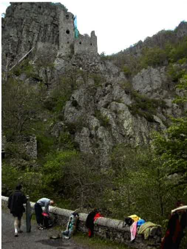
sortie du canyon au hameau de Borne