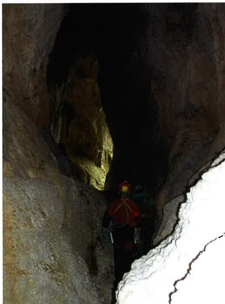
sortie de la Cotepatière