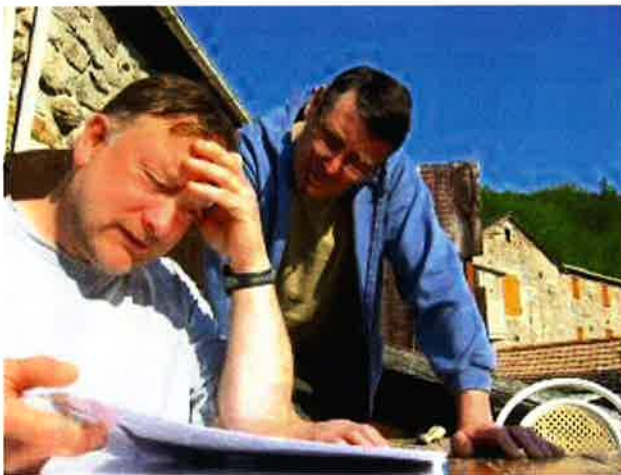
le président et le trésorier préparent la sortie